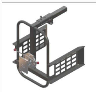
STOR DUNKHOLDER TIL DUNKE med en volumen på 60 liter