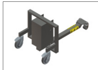
CENTER Passer til europaller