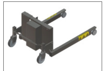
FLEX 1 ELLER FLEX 2 Benbredden er fleksibel og kan justeres fra 450-610 mm (FLEX1) eller fra 650 til 810 mm (FLEX2).