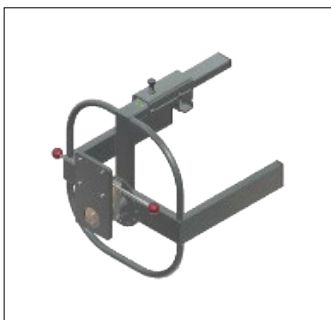
LILLE DUNKHOLDER TIL DUNKE med en volumen på 15-25 liter

Den innovative dunkholder kan leveres i to forskellige størrelser. Den lille dunkholder kan håndtere dunke med et volumen fra 15-25 liter, og den store dunkholder anvendes til en 60-liters dunk.